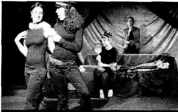
SCÈNE. Enfants et adolescents bientôt sur la scène du festival de Sardent.

Les portes du festival Escapade au pays d'enfants sur scène s'ouvrent du 4 au 7 juillet. Au cœur de cette manifestation, l'enfant, le théâtre, parce que « le Théâtre d'enfant, c'est le théâtre d'adulte, en mieux... ».