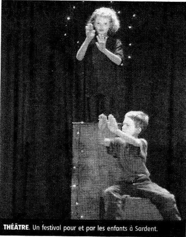
THÉÂTRE. Un festival pour et par les enfants à Sardent.